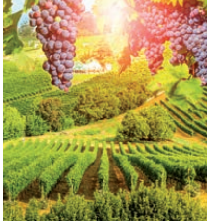
Viñedos Ciudad del Cabo