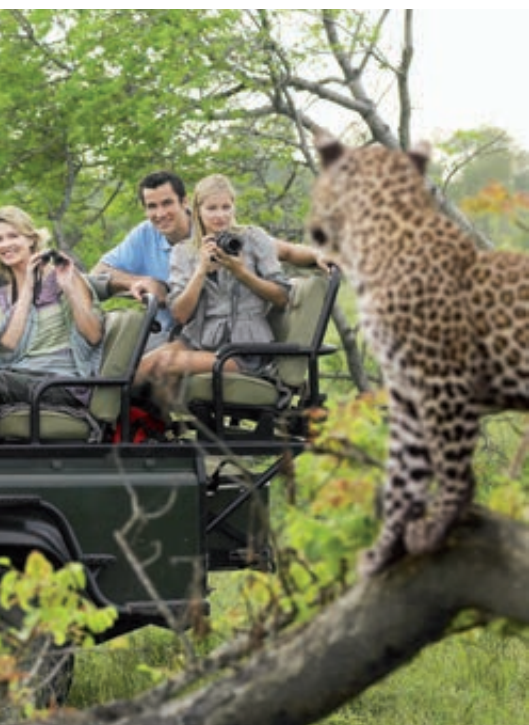
Safari en Parque Kruger

Desayuno. A la hora indicada, traslado al aeropuerto de Ciudad del Cabo. Fin del viaje y de nuestros servicios.