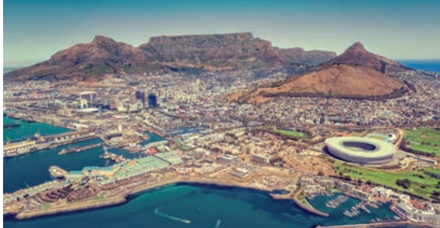
Ciudad del Cabo

ción vinícola sudafricana tiene más de tres siglos de historia, forma parte de la cultura y de las señas de identidad del país. Aprenderemos el proceso de elaboración vinícola desde que es uva hasta ser servido en copa. Almuerzo en Stellenbosch. A continuación, visita de Franschhoek, una de las localidades más antiguas de Sudáfrica y uno de los lugares más pintorescos del Sur de África. Cena y alojamiento.