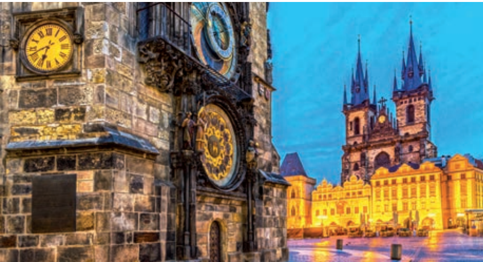
Reloj astronómico e Iglesia de Tyn (Praga)