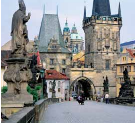
Puente de Carlos (Praga)