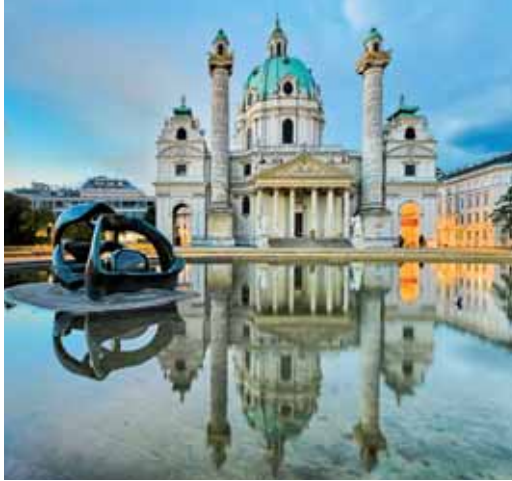
Iglesia de San Carlos Borromeo (Viena)