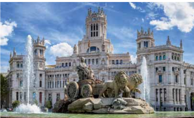
Plaza de Cibeles (Madrid)

1) En Frankfurt, Florencia, Roma y Madrid.