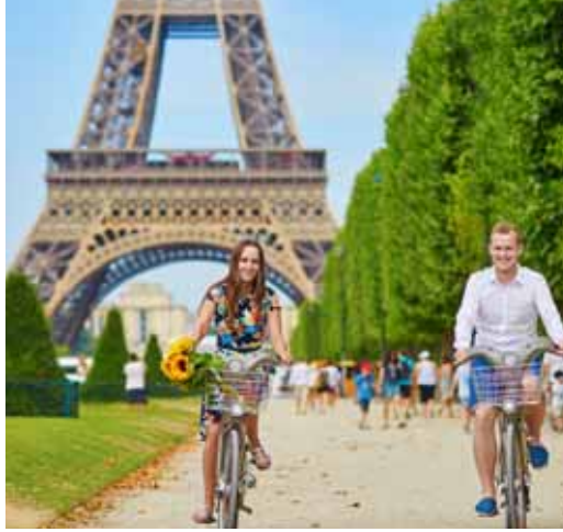
Torre Eiffel (París)