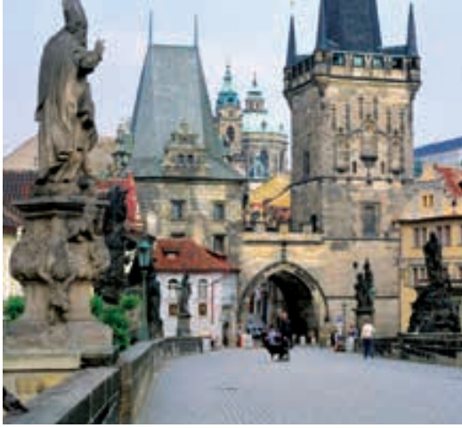
Puente de Carlos (Praga)