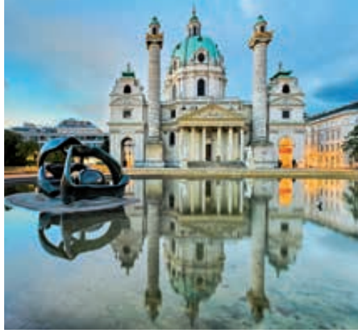
Iglesia de San Carlos Borromeo (Viena)