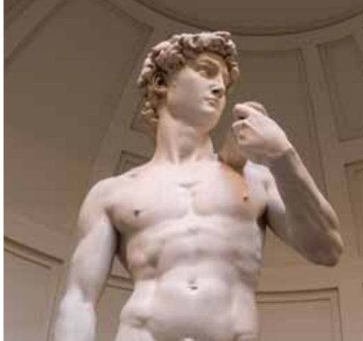
El David de Miguel Ángel (Florencia)

celo, Castillo de Santo Angel, la famosísima Plaza de Venecia. Por la tarde realizaremos opcionalmente la visita de Roma barroca; recorrido por las principales plazas de la ciudad, visitando la famosa Fontana de Trevi, Panteón y la espectacular Plaza Navona. Alojamiento.