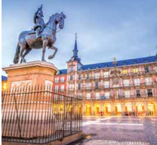
Plaza Mayor (Madrid)