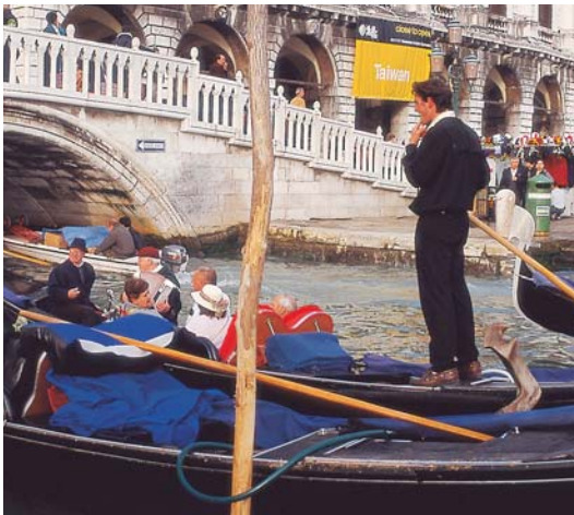
Paseo en góndola (Venecia)