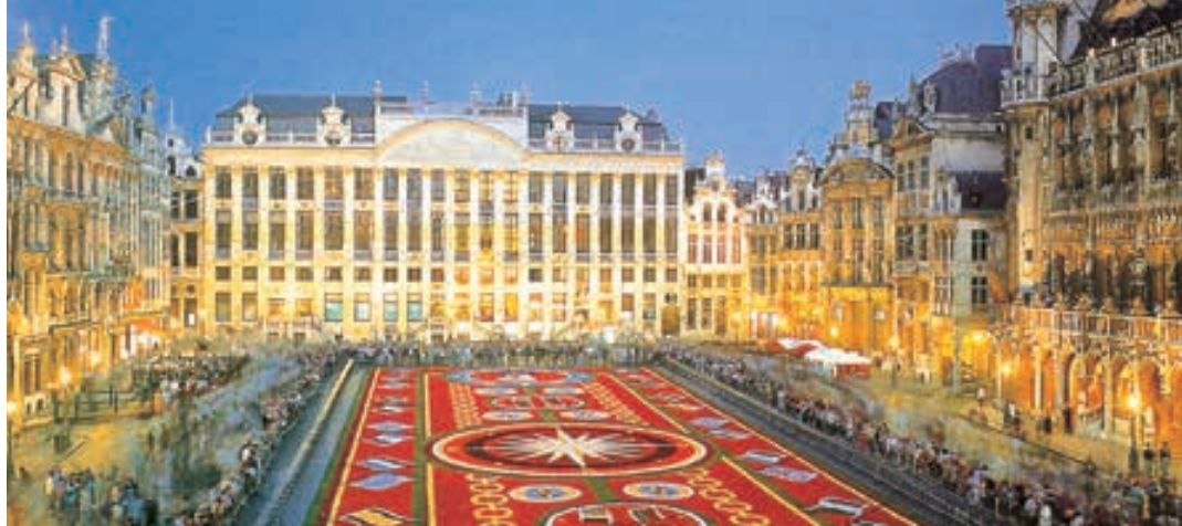
Grand Place (Bruselas)