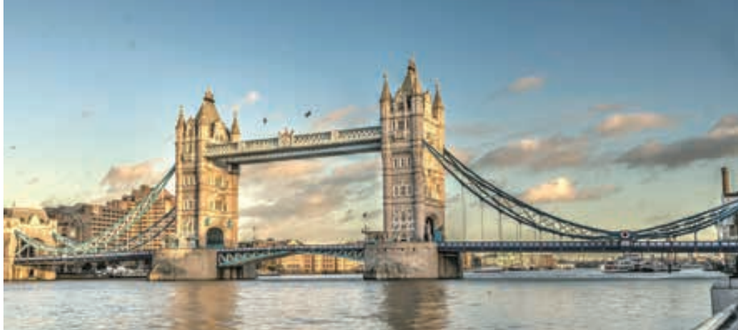
Puente de Londres

ves del Renacimiento. En la Catedral de Santa María de las Flores, contemplaremos su magnífica cúpula del arquitecto Brunelleschi. Visitaremos también la Plaza de Signoria, el Palacio de Gobierno de los Medici y el Campanile de Giotto. Resto del día libre. Opcionalmente podrá visitar los Museos Florentinos y la Academia, donde podrá disfrutar contemplando el famoso "David" de Miguel Ángel y otras obras maestras. Cena (opc. MP) y alojamiento.