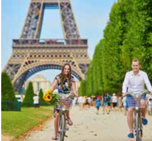
Torre Eiffel (París)

Renacimiento. En la Catedral de Santa María de las Flores, contemplaremos su magnífica cúpula del arquitecto Brunelleschi. Visitaremos también la Plaza de Signoria, el Palacio de Gobierno de los Medici y el Campanile de Giotto. Resto del día libre. Opcionalmente podrá visitar los Museos Florentinos y la Academia. Cena (opc. MP) y alojamiento.