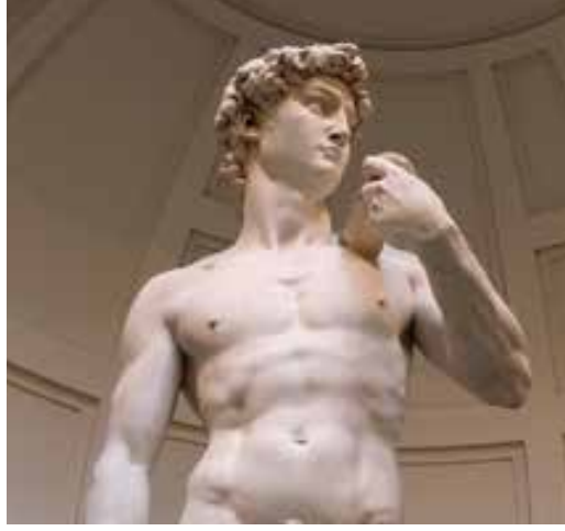
El David de Miguel Ángel (Florencia)

Illo de Santo Angel, la famosísima Plaza de Venecia. Por la tarde realizaremos opcionalmente la visita de Roma barroca; recorrido por las principales plazas de la ciudad, visitando la famosa Fontana de Trevi, Panteón y la espectacular Plaza Navona. Alojamiento.