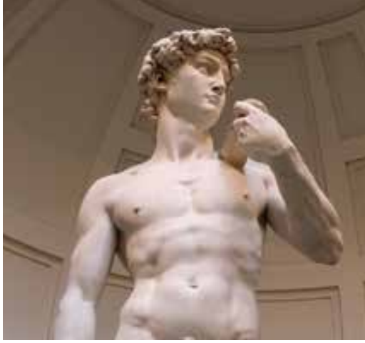
El David de Miguel Ángel (Florencia)

llo de Santo Angel, la famosísima Plaza de Venecia. Por la tarde realizaremos opcionalmente la visita de Roma barroca; recorrido por las principales plazas de la ciudad, visitando la famosa Fontana de Trevi, Panteón y la espectacular Plaza Navona. Alojamiento.