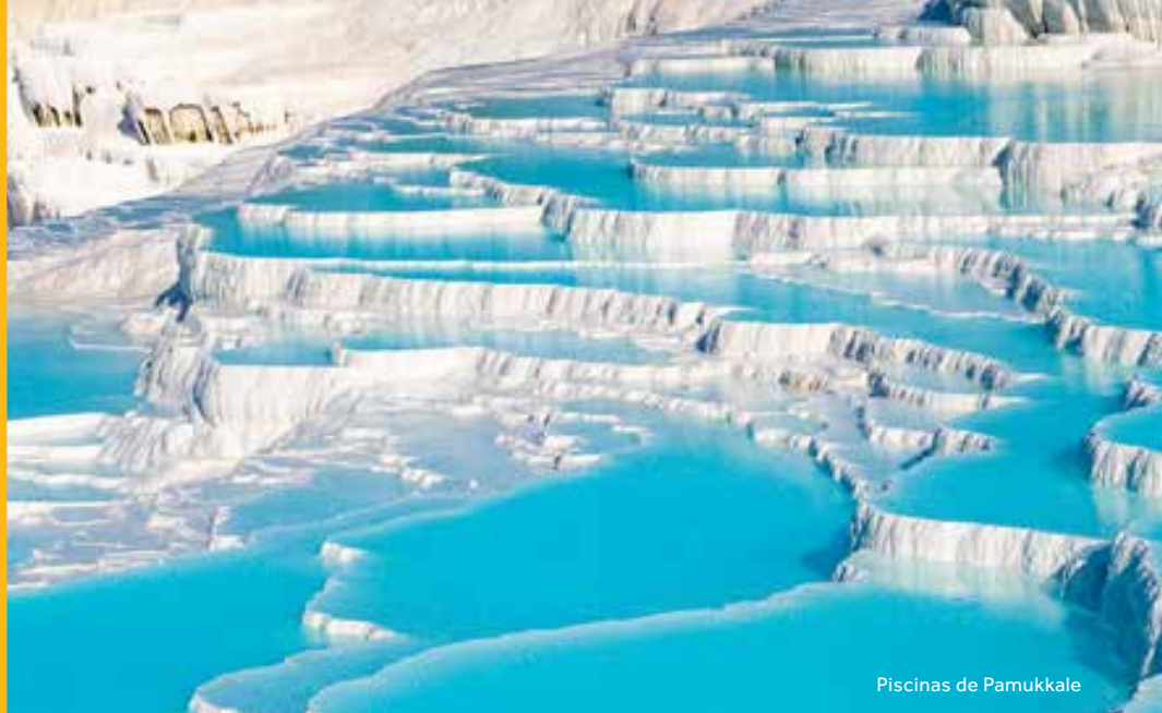
Piscinas de Pamukkale