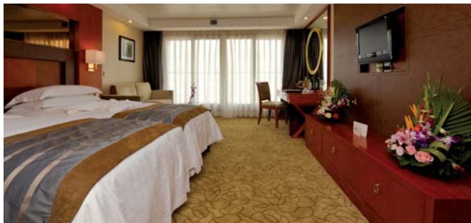
Camarote del Barco MS Century Diamond

como el desfiladero de la Bruja, pasando por el desfiladero de Qutang, dejando entre tanto, pequeños pueblos por los cuales parece que la huella del tiempo no ha transcurrido. Por la noche, tendrán la cena de despedida del capitán , donde recordaremos los momentos vividos en el barco.