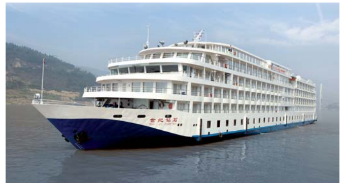
Barco MS Century Diamond

dinastía Ming así como 23 emperatrices, cortesanos y concubinas de la corte. En julio de 2003 fueron declaradas como Patrimonio de la Humanidad por la UNESCO. A la vuelta haremos una parada para tomar fotos en el mundialmente conocido "nido de pájaro" construido para los juegos olímpicos de China de 2008 . Por la noche tendrán la posibilidad (opcional) de poder probar uno de los platos más típicos del país el pato lacado, uno de los manjares preferidos del Imperio Ming.