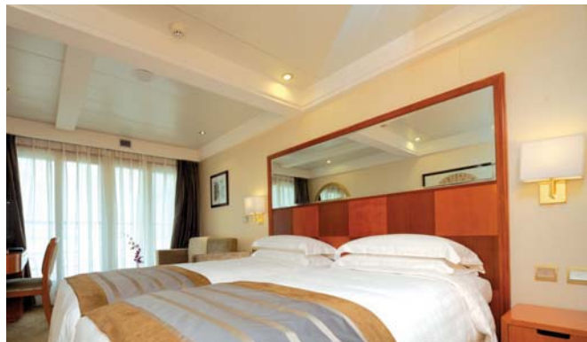
Camarote del Barco MS century Diamond

desde 1961 y se incluyó en el Patrimonio cultural de la humanidad de la UNESCO en 1987. Visitaremos también el Templo del Cielo , siendo el mayor templo de su clase en todo el país. Fue construido en 1420, y tanto la dinastía Ming como Quina lo utilizaron para rogar por las cosechas y dar gracias al cielo por los frutos obtenidos. Desde 1998 está considerado como Patrimonio de la Humanidad por la UNESCO. Por la noche tendrán la posibilidad de asistir opcionalmente a la ópera de Pekín con cena.