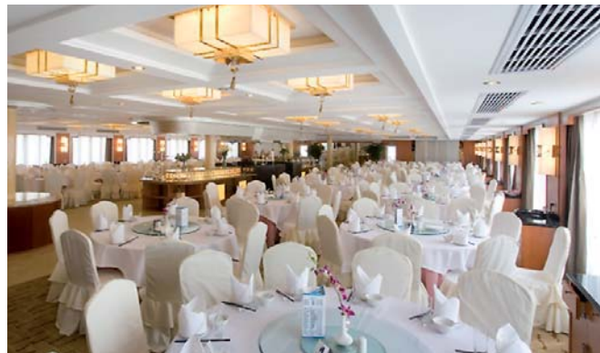
Restaurante del Barco MS century Diamond

para que durara varios siglos sin afectar a las personas que viven en sus alrededores. Por la noche tendrá lugar el show del capitán donde la tripulación les dará la bienvenida.